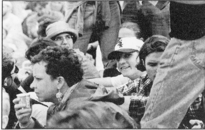
Også kronprins Haakon Magnus hadde funnet velen til Kalvøya i går.