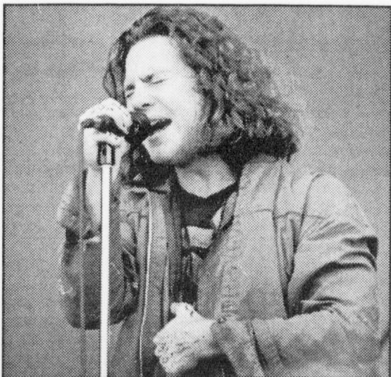
Pearl Jam overbeviste sterkt i løpet av to konserter i Oslo-området.