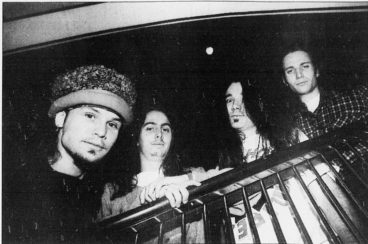
– Stone Gossard, Jeff Ament, Mike McCready og Dave Krusen - fire femtedeler av Pearl Jam - nok et Seattle-band med punkenergi og hardrock-tingde.

Men det er bassist Jeff og gitarist Stone som er grunn-