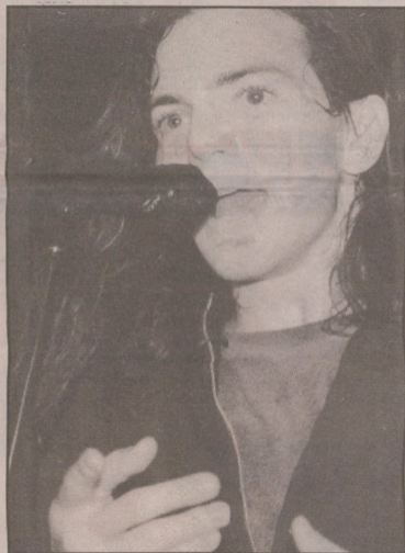
Scennärvaro och laddad energi på Kool Kat med Pearl Jam i går kväll.